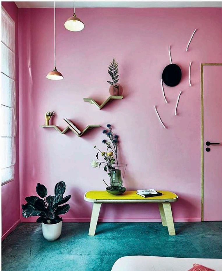
Roze kamer/Margriet: Muurhaken, Miel Cardinael. Muurplankjes, Hannemans. Zitbank, rform. Lamp, Luca Beel. Vaas, Valerie Objects.

Zo draait de Emile-kamer – vernoemd naar de grootvader van Gwynn, de oorspronkelijke eigenaar van het huis – rond brute, natuurlijke materialen. Ze kozen onder andere voor een bed van Vormen, waarvan het frame uit gestapelde volhouten balken bestaat, en een betonnen vloerlamp van Ministry of Mass. Een wandmeubel van Filip Janssens bepaalt samen met de